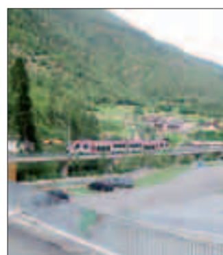
L'area di Daolasa