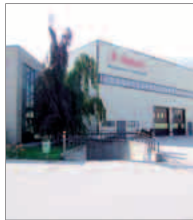
Lo stabilimento di Cles

CLES - Dalmec spa, pur avendo risentito della situazione economica generale, è riuscita a resistere alla crisi con un fatturato che al 31 dicembre 2009 ammontava a 20.307.289 euro (meno 23% rispetto al 2008 con un decremento di 6,3 milioni).